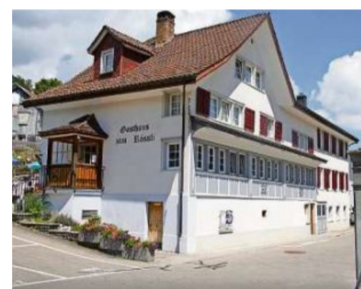
Hier essen Sie sehr gut: Das «Rössli» steht mitten im Dorf Goldingen in der Gemeinde Eschenbach.

auf dem Weg zu Restaurants immer, dass sie nur «etwas ganz Kleines» essen wolle. Meiner Ansicht nach gründet dieses Verhalten in ihrer Kindheit in den Kriegsjahren, die von Verzicht geprägt waren. Weil ihr ein paar Kilo mehr auf den Rippen gut anstehen würden, bestehe ich jeweils darauf, dass sie Vor- und Hauptspeise bestellt. Als ihre Marroni-Dattel-Ravioli mit in Butter geschwenkten Trauben und Orangwürfeln (kleine Portion Fr. 22.50) serviert werden, sagt sie, die Portion sei viel zu gross. Doch dann putzt sie alles weg, und mir ist klar: Ich kann Ihnen dieses Lokal empfehlen.