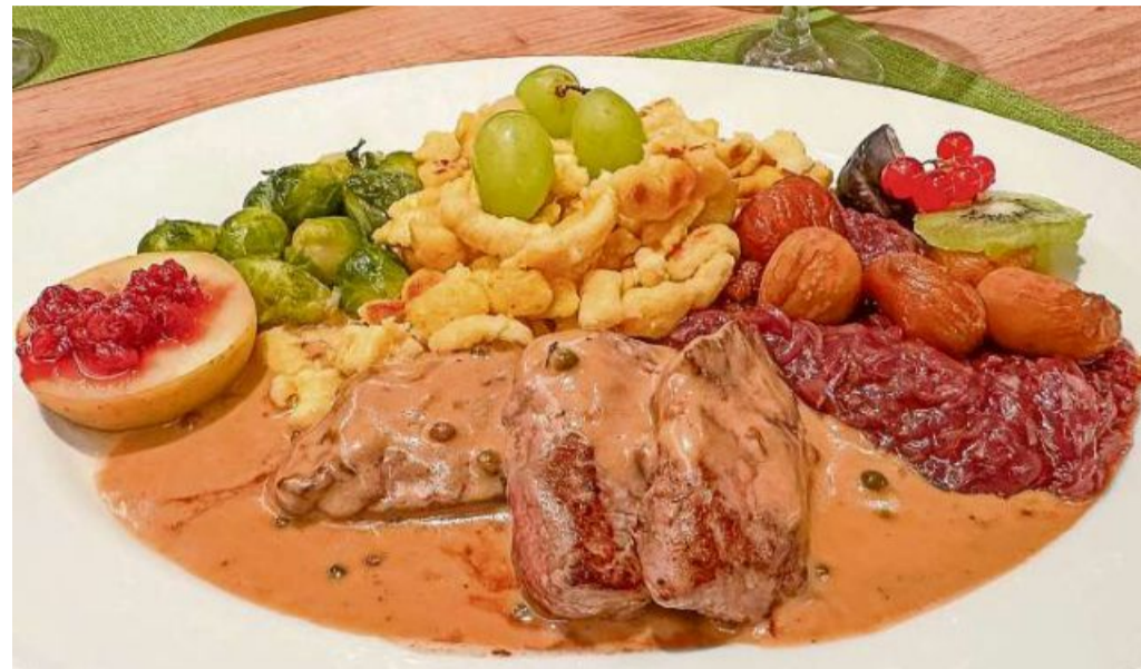
Cremige Sauce, butterzartes Fleisch: Im «Rössli» gibt es einen wunderbaren Rehrücken.

Der Appetit meiner Mutter ist ein zuverlässiger Massstab, wenn es um Qualität geht. Sie ist zwar genügsam und würde sich in einem Restaurant nie beschweren. Aber mit zunehmendem Alter (bald 91-jährig) betont sie