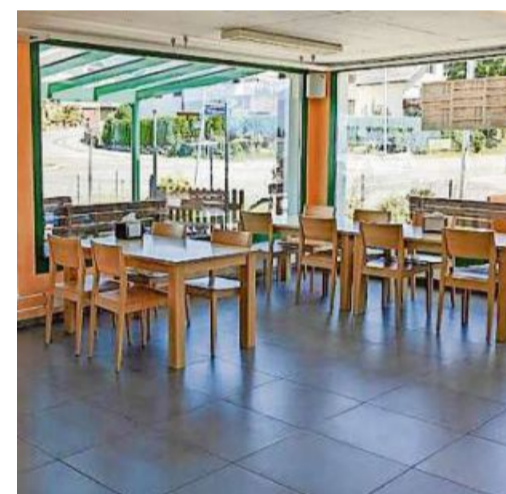
Hell und geräumig: das Lokal.