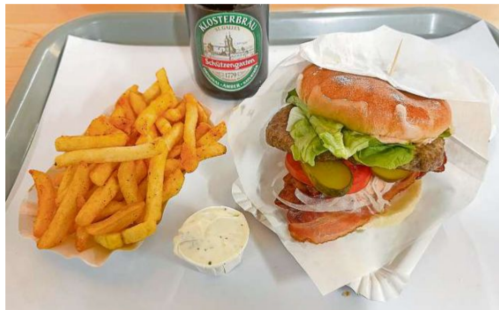
Preiswert und gut: Hamburger Spezial mit Pommes, Tartarsauce und Klosterbräu.